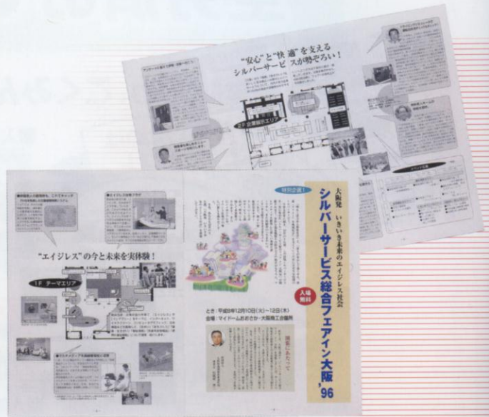
21号「シルバーサービス総合フェア イン 大阪'96」特集誌面