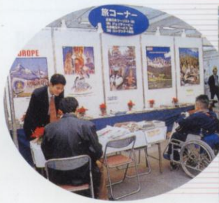
企業展示コーナー