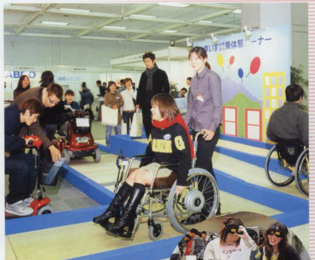
42号掲載の 「第7回シルバーサービス総合 フェア イン 大阪2001」 上/車いす試乗体験コーナー 右/インスタントシニア体験コ ーナー