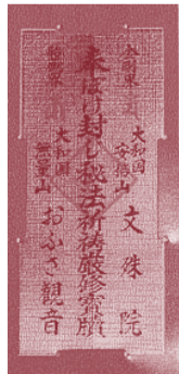
ぼけ封じの祈禱札